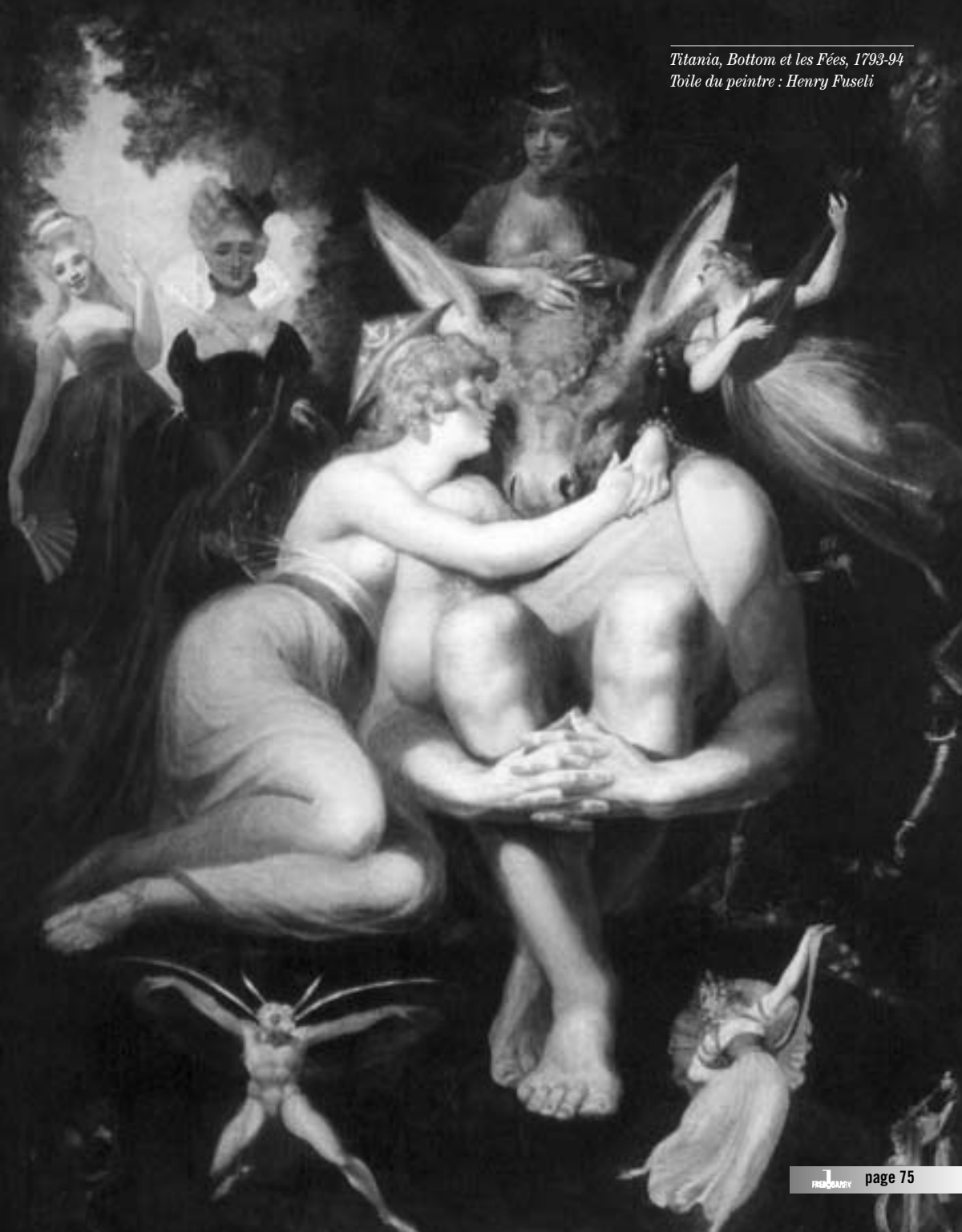
Titania, Bottom et les Fées, 1793-94 Toile du peintre : Henry Fuseli